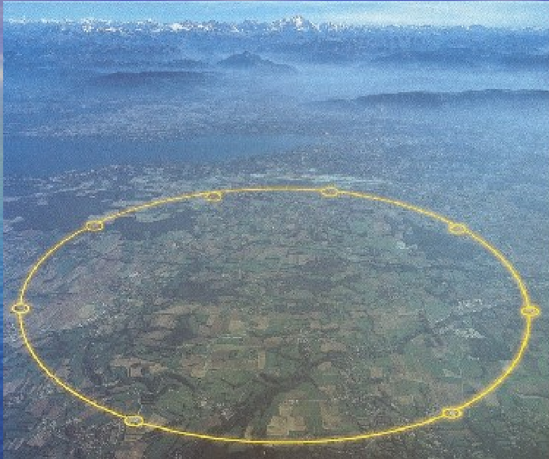
Large Hadron Collider